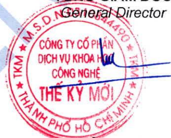
ThS. Hồ Phùng Tâm