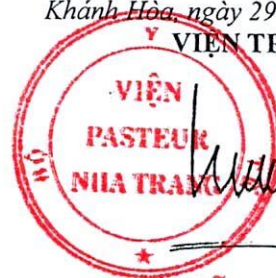
Đỗ Thái Hùng