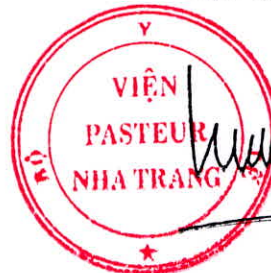
Đỗ Thái Hùng