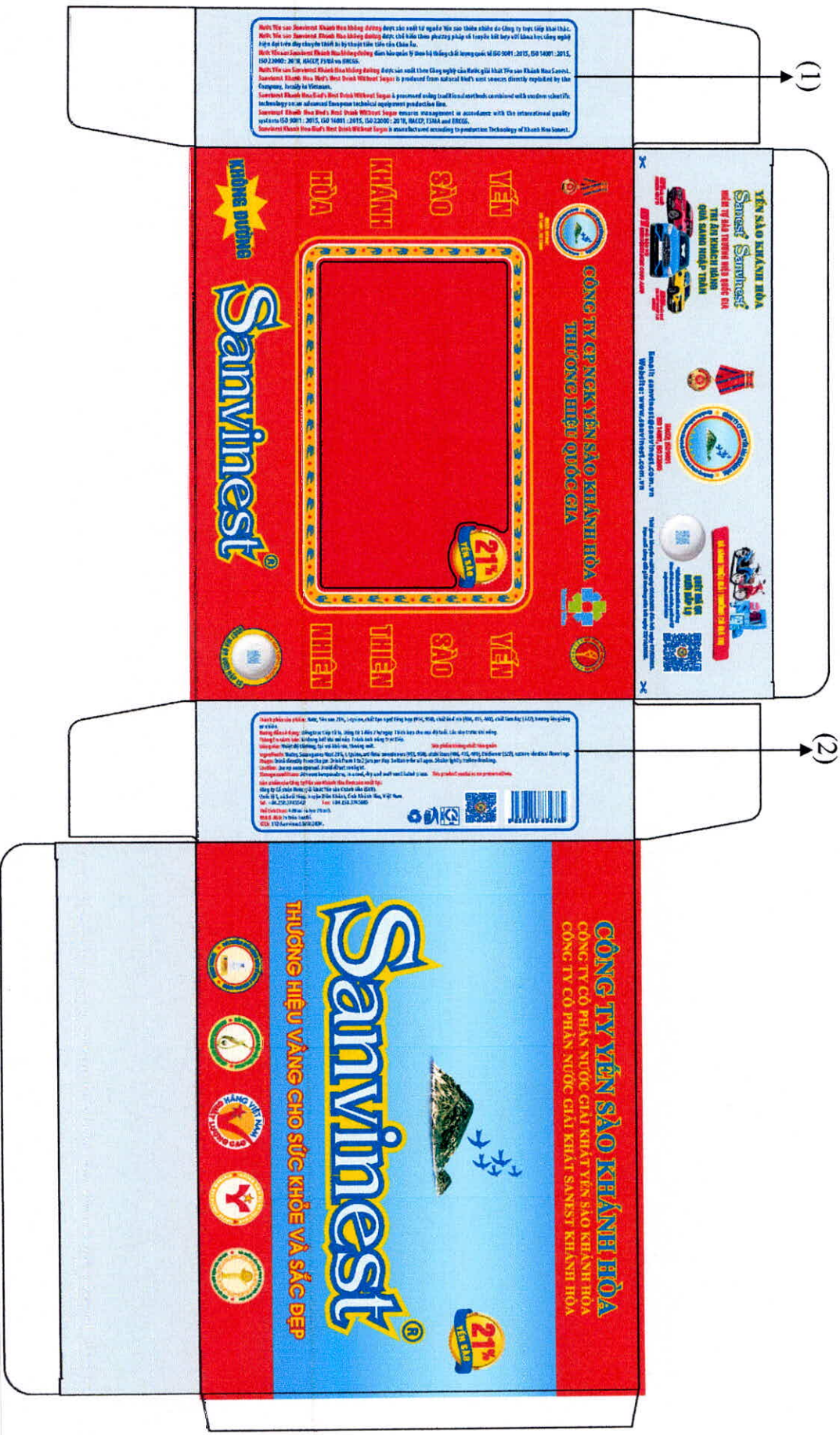
Mẫu hộp 06 sản phẩm