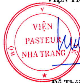
Đỗ Thái Hùng