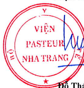
Đỗ Thái Hùng