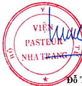
Đỗ Thái Hùng