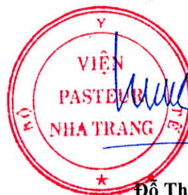
Đỗ Thái Hùng