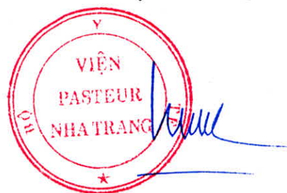
Đỗ Thái Hùng