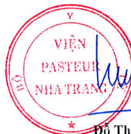
Đỗ Thái Hùng