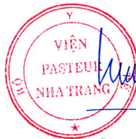
Đỗ Thái Hùng