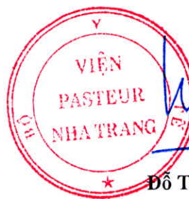
Đỗ Thái Hùng