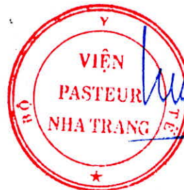
Đỗ Thái Hùng