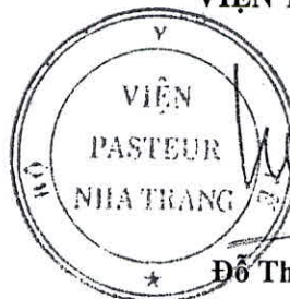
Đỗ Thái Hùng