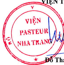
Đỗ Thái Hùng