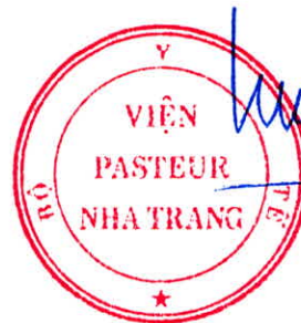
Đỗ Thái Hùng