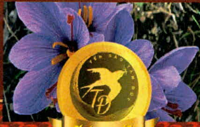
NHUY HOA NGHỆ TÂY

Sản phẩm chịu trách nhiệm bởi: CTY TNHH THƯƠNG MẠI VÀ DỊCH VỤ TÂM ĐỨC Địa chỉ số: 545 Lê Hồng Phong, phường Phước Hòa, thành phố Nha Trang, tỉnh Khánh Hòa Sân xuất tại: Số 6 đường Hoàng Hoa Thám, khu phố Tây A, phường Đông Hòa, thành phố Dĩ An, tỉnh Bình Dương, Việt Nam Điện thoại: 0837.095.360 Email: yentamduc2026@gmail.com Website: https://sites.google.com/view/yentamduc Số TCB: 11/TAMDUC/2023 HSD: Xem trên bao bì