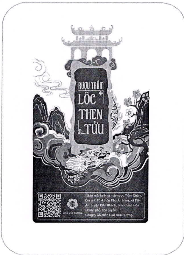
Mặt sau chai rượu Lộc Then Tửu 500ml