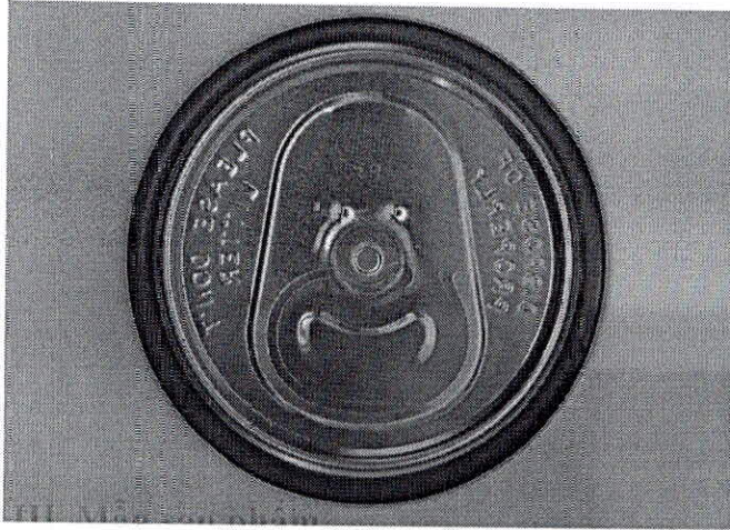
a. Mặt dưới