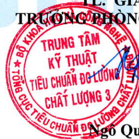
Ngô Quốc Việt