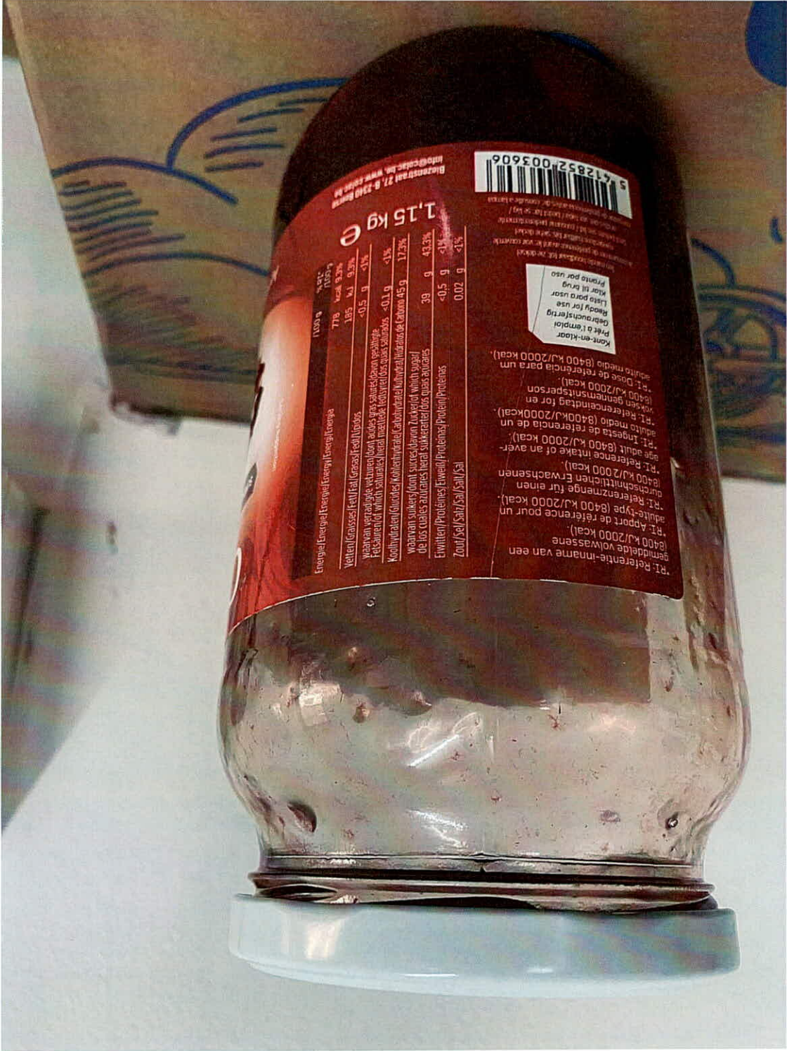
MÀU NHẬN SẴN PHẨM