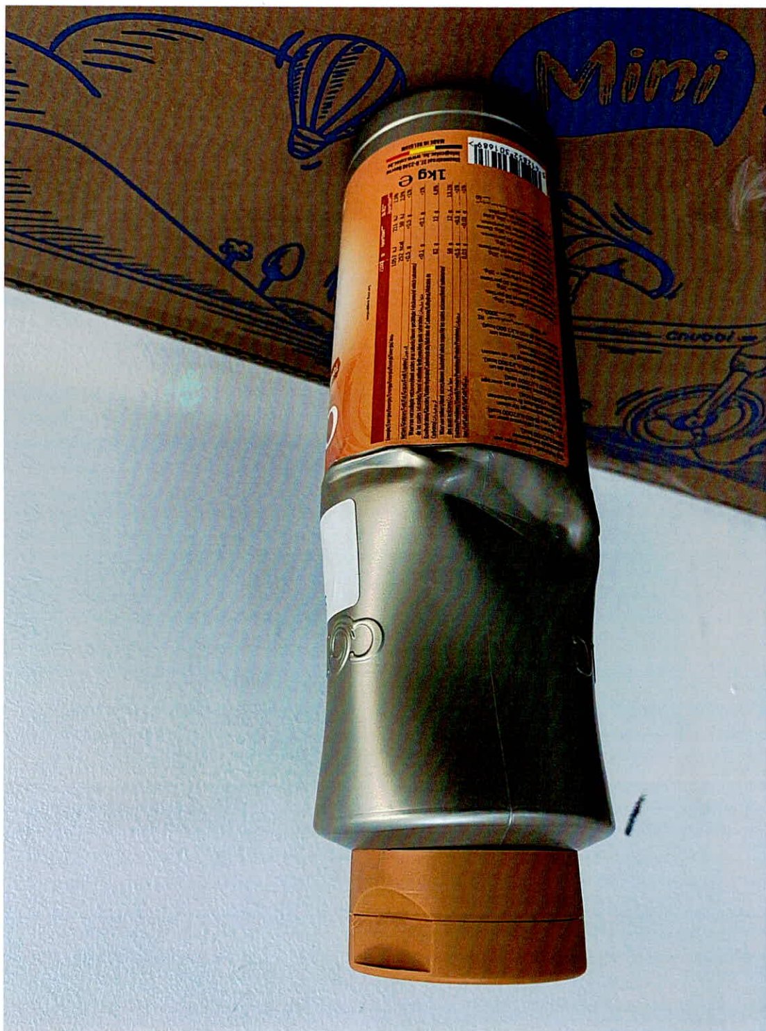
MẪU NHẬN SẢN PHẨM