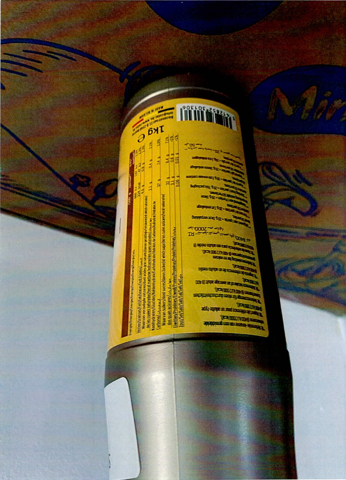
MÀU NHÃN SẢN PHẨM