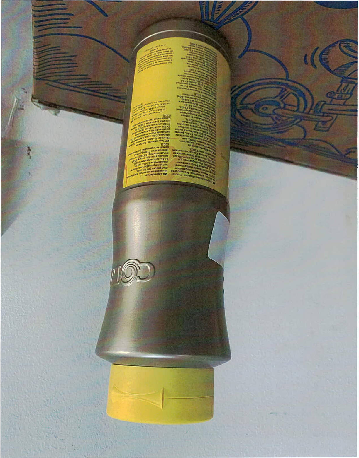
MÀU NHÃN SẢN PHẨM