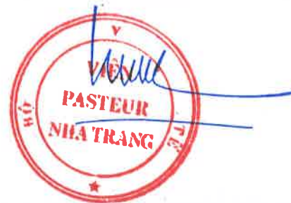
Đỗ Thái Hùng