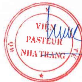
Đỗ Thái Hùng