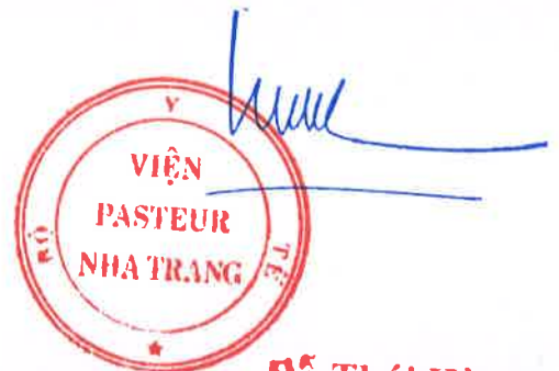
Đỗ Thái Hùng