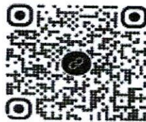
Mã QR tài liệu

Mã QR để lấy tài liệu các dự án Luật, Pháp lệnh: